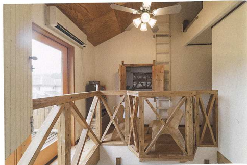
以前は無かった吹き抜けを作ったことで2階の1室がテラス席のようなスペースに変身。