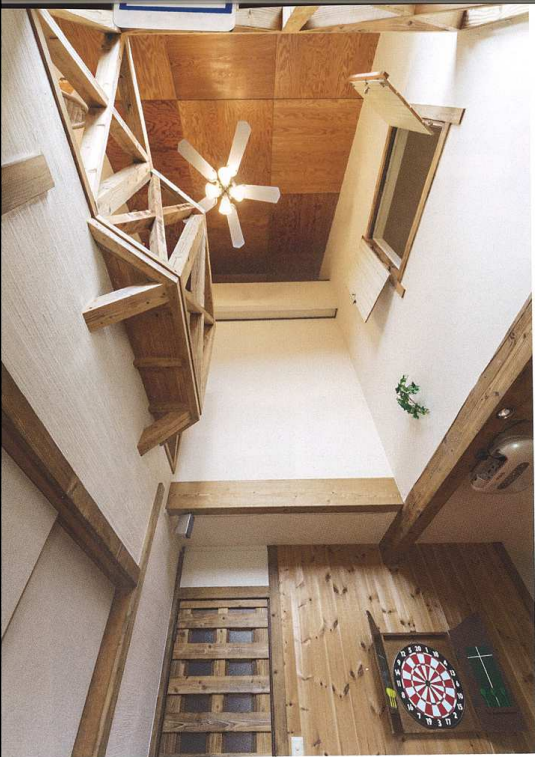
かつて天井板があったリビングスペース。吹きぬけにして開放的に。