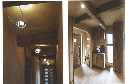
明るすぎない廊下の照明。