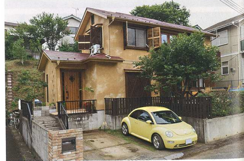
壁色を暖色のあるアースカラーにして雰囲気を一変したK邸。