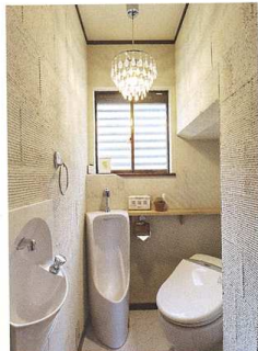
アメリカ製の照明が異国情緒を醸し出すサニタリールーム。