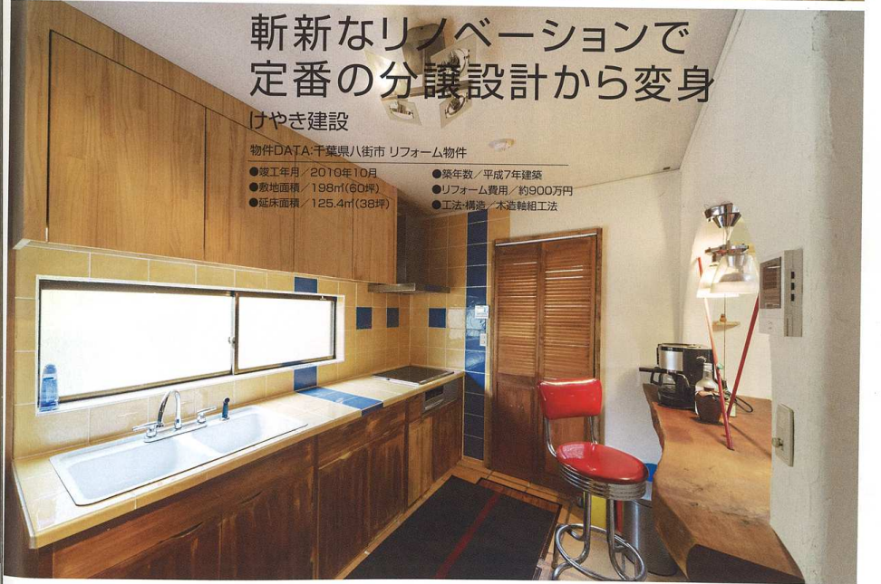
上/キッチンの壁にアールをつけた開口部と無垢材のカウンターを設け活潑な雰囲気に仕上げたリビングダイニング。耐力は鉄筋を入れ補強。下/タイル張りにしてキッチンの雰囲気を一変。